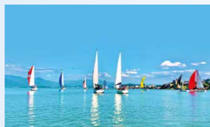
23 Regatas de Oceano