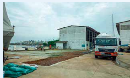
27 Obras e Realizações