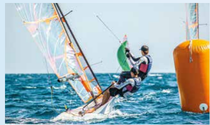
10 Mundial de 29er