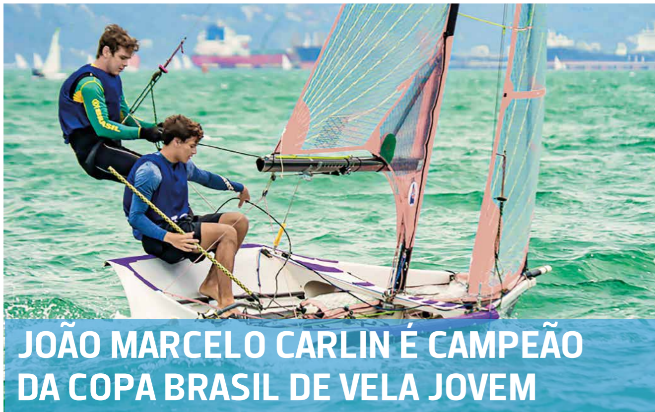
Ateliê Fred Hoffmann