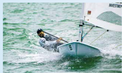
13 Sul-Brasileiro de ILCA