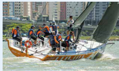
20 Volta à Ilha