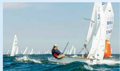
14 Mundial e Sul-Americano de Snipe